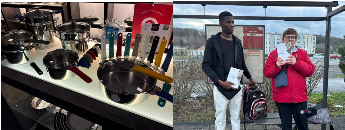
Le show-room Cristel