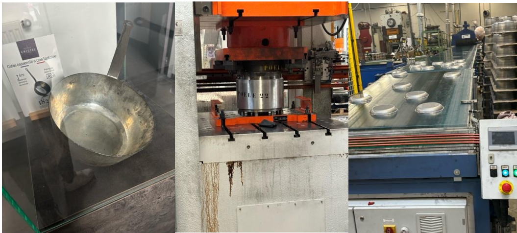
La première casserole pressée Presse à emboutissage. Lavage des casseroles Chez Cristel

Les élèves ont découvert l'usine et les différentes étapes de la fabrication des poêles et casseroles de la marque, de l'emboutissage au polissage.