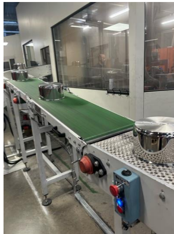
Sortie des casseroles, prêtes à l'emballage